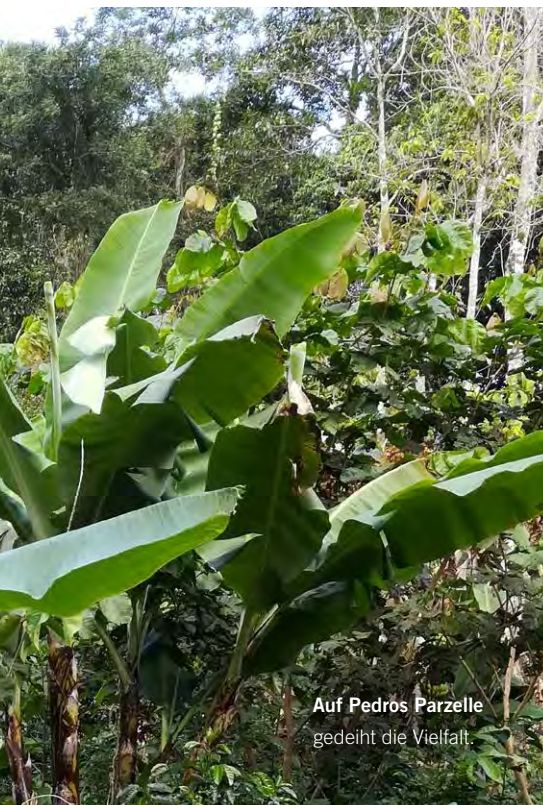
Auf Pedros Parzelle gedeiht die Vielfalt.